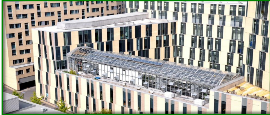
Pavillon des sciences biologiques, Complexe des sciences, UQAM